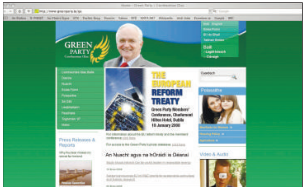
Suímh idirlín na bpáirtithe

Más léiriú iad suímh na mór-pháirtithe ar a ndearcadh ar an Ghaeilge, is beag dóchas a bheidh fágtha ag an 1.65 milliún le Gaeilge sa stát. Tá sé in am brú a chur ar na Teachtaí Dála a thaispeáint dúinn cad é an dea-thionchar a bheidh acu ar úsáid na Gaeilge. Caith do vóta leis an dream is treise ar a son, sa chéad toghchán eile.